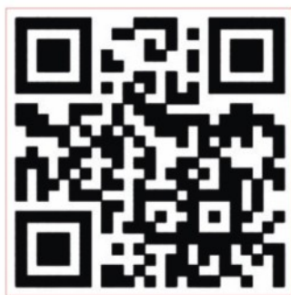
全国学生资助管理中心网站